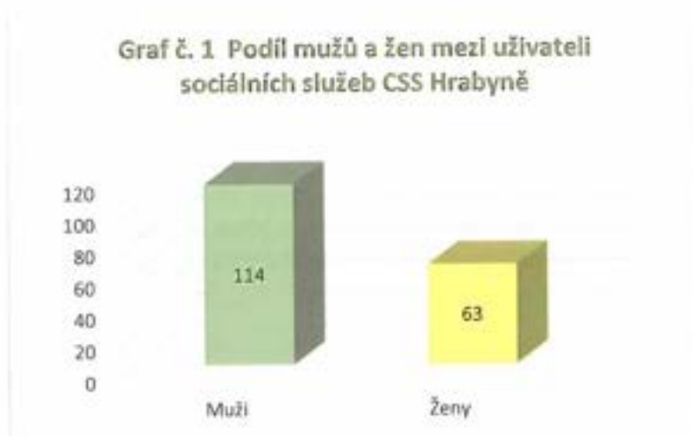
Graf č. 1 Podíl mužů a žen mezi uživateli sociálních služeb CSS Hrabyně

Průměrný počet uživatelů sociálních služeb za rok 2021: 175,7 využití kapacity 96,0 %.